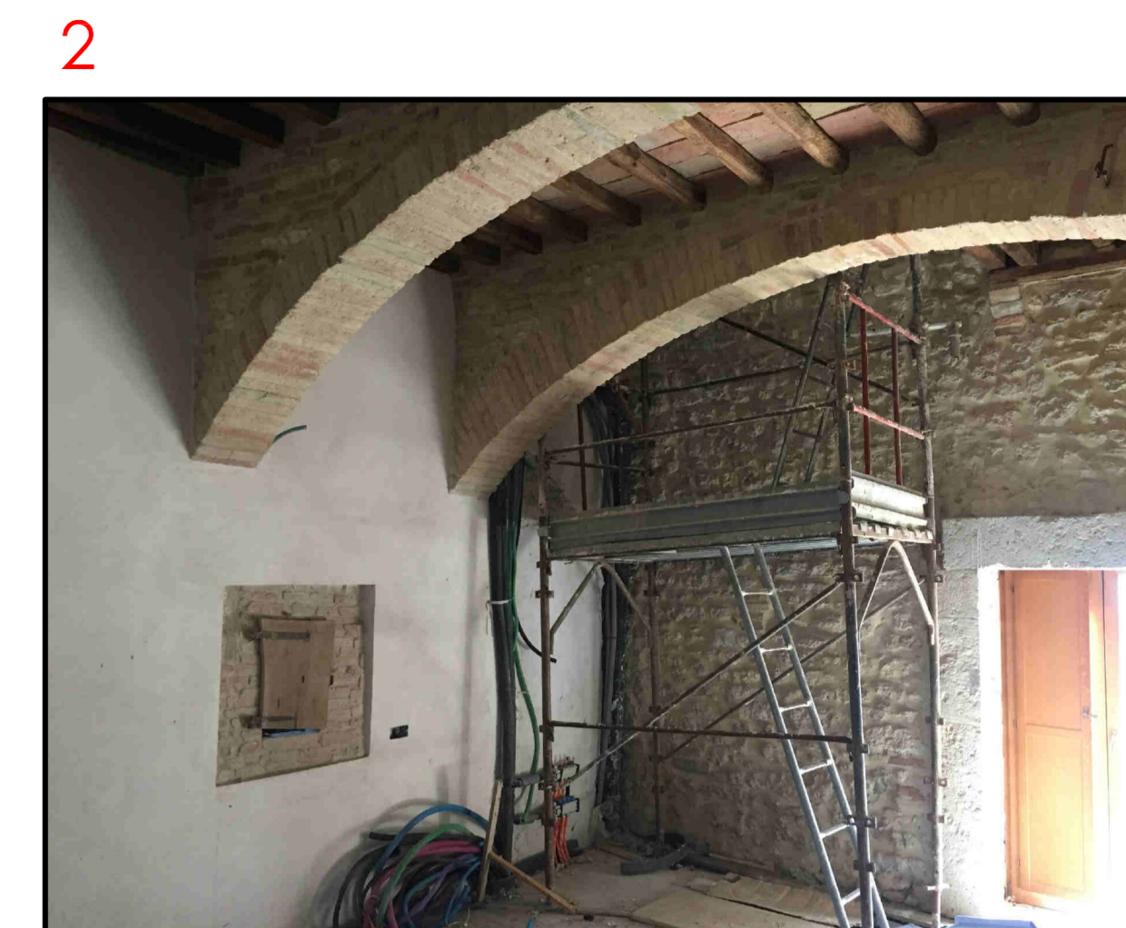
la zona dove deve essere realizzata la scala di collegamento ove era già presente l'apertura nei due solai sovrastanti