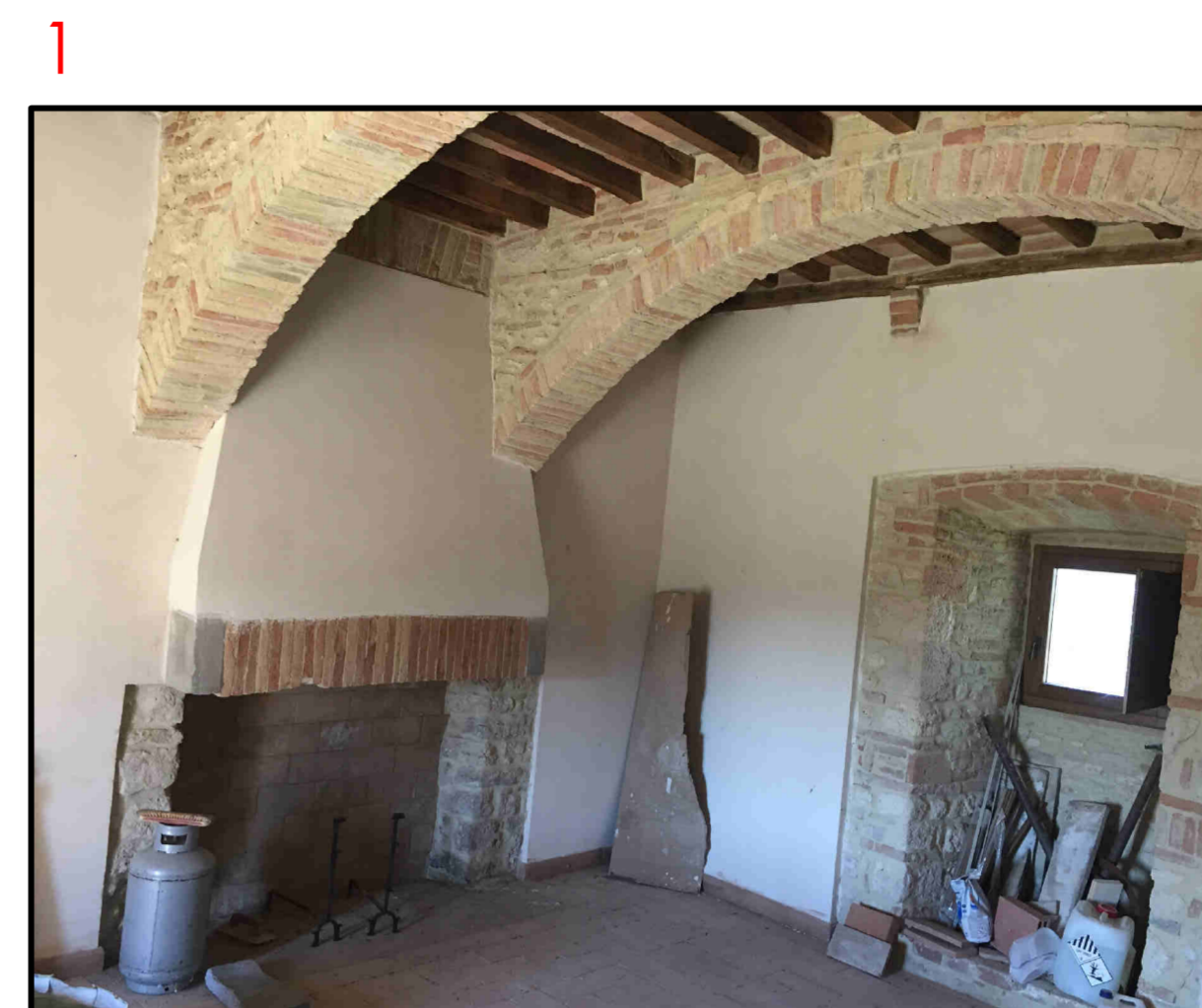
la stanza con il camino antico recuperato