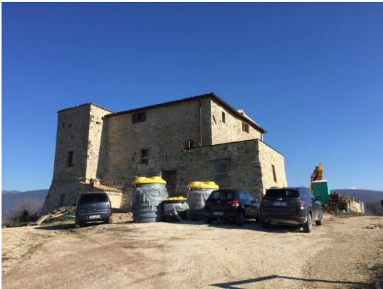
il complesso in restauro visto dall'imbocco della strada privata