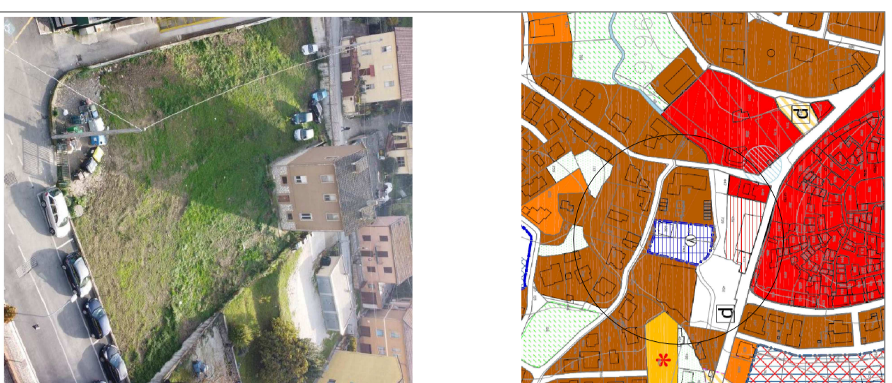
PROGETTO schema tipologico scala 1:200