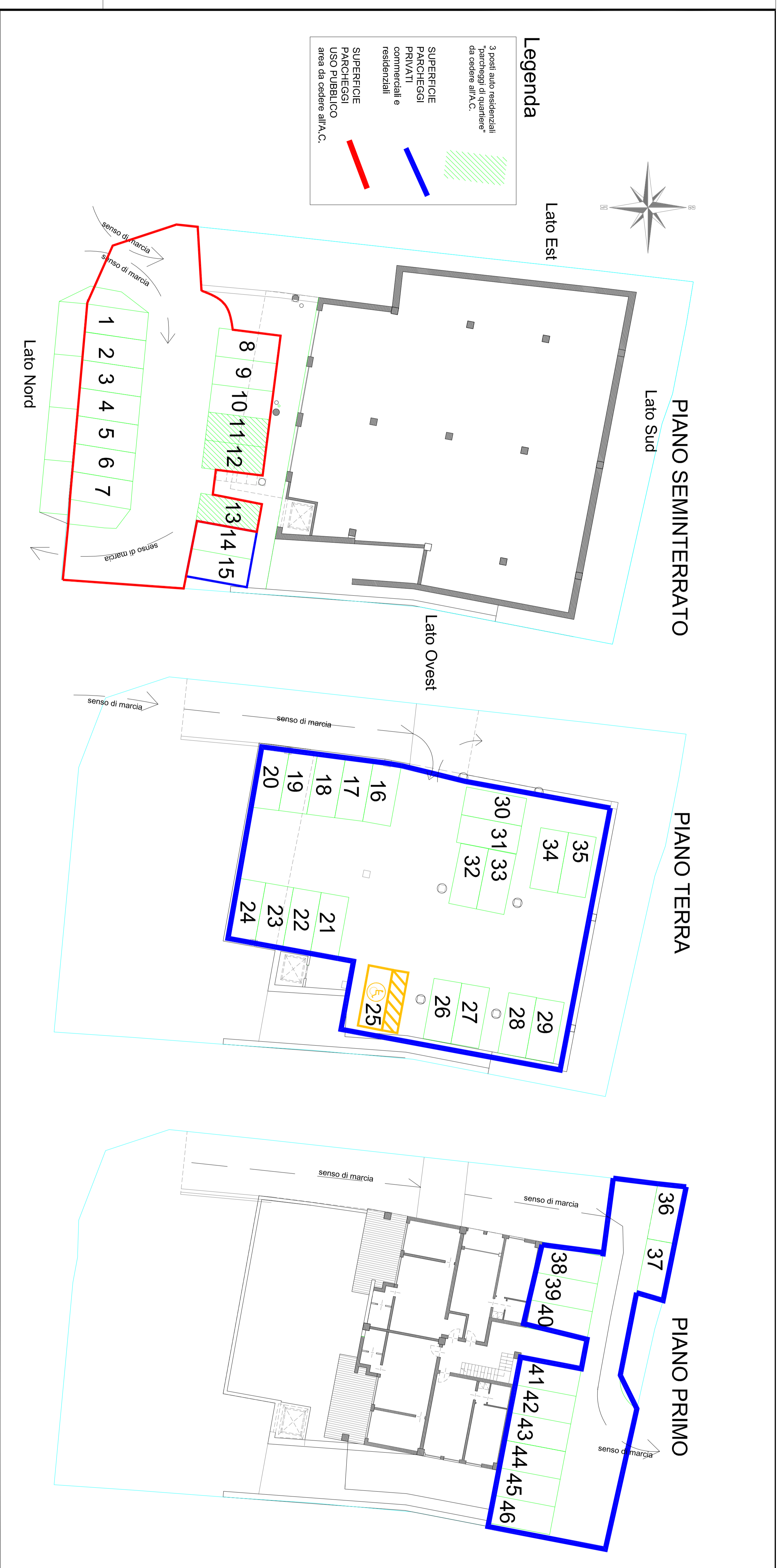
AREA POSTI AUTO DA CEDERE - pianta descrittiva dell'intervento per la realizzazione dei parcheggi